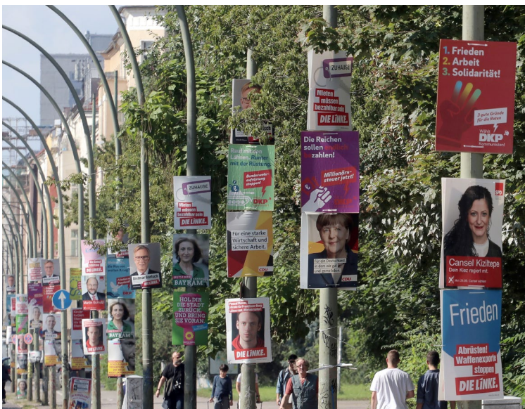
Wahlkampf in Berlin zur Bundestagswahl 2017

Angesichts der drastisch erhöhten Zahl bewaffneter Konflikte und der Ungewissheit über den politischen Kurs der USA heißt es von vielen Seiten, Deutschlands internationale Verantwortung sei gewachsen. Das umstrittenste Mittel zur Übernahme einer solchen Verantwortung sind Auslandseinsätze der Bundeswehr, vor allem die mit Mandat zur Anwendung militärischer Gewalt. Kontroversen über laufende oder anstehende Beteiligungen an solchen Einsätzen haben Wahlen und Regierungsbildungen mitentschieden. Wie stehen die Parteien vor der Bundestagswahl zu Auslandseinsätzen der Bundeswehr? Nicht alle präsentieren eine klare Position oder begründen ihre Haltung.